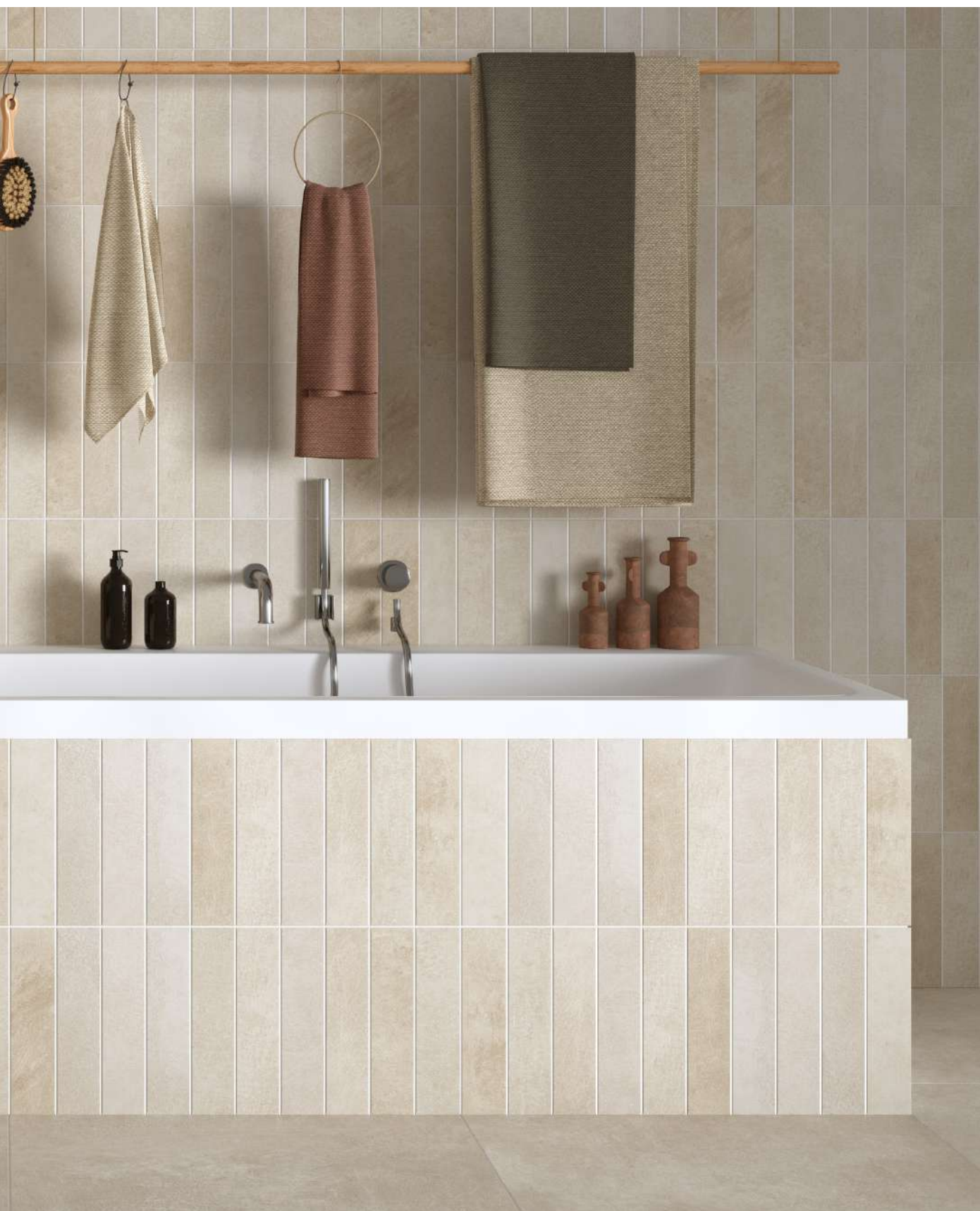
RIVESTIMENTO: ROMA 25x60 BEIGE E BRICK BEIGE PAVIMENTO: ROMA 60x60 BEIGE