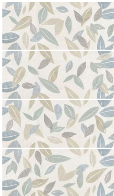
25x60 DECORO FOLIAGE HRWD02