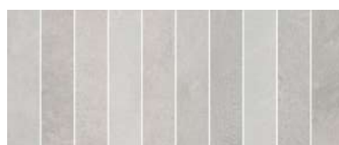
25x60 BRICK GRIGIO HVWR12