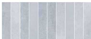
25x60 BRICK CELESTE HVWR13