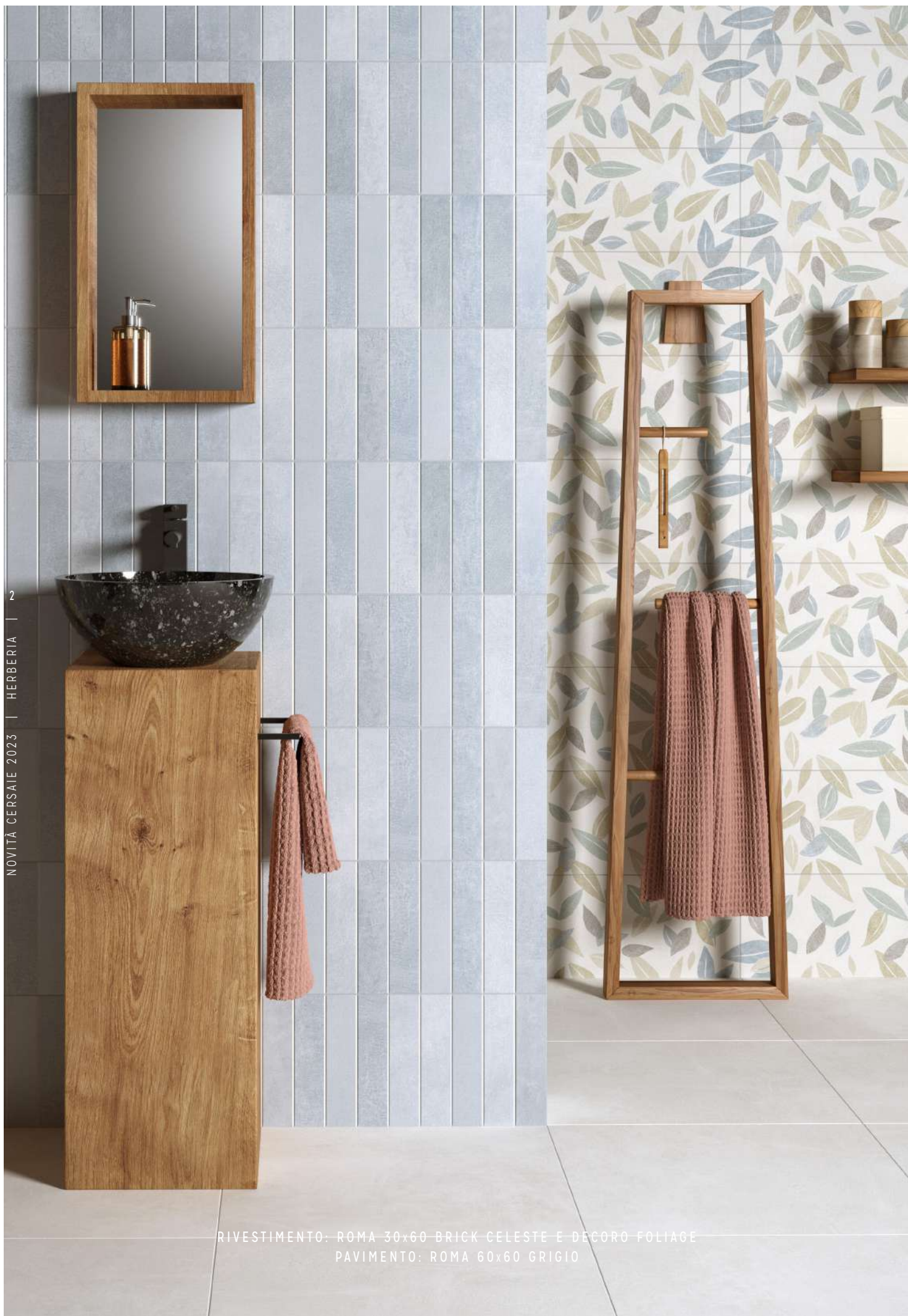
RIVESTIMENTO: ROMA 30x60 BRICK CELESTE E DECORO FOLIAGE PAVIMENTO: ROMA 60x60 GRIGIO