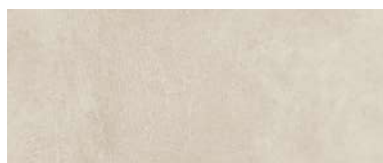
25x60 BEIGE HRWR01