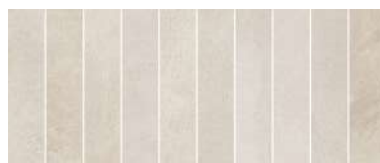
25x60 BRICK BEIGE HVWR11