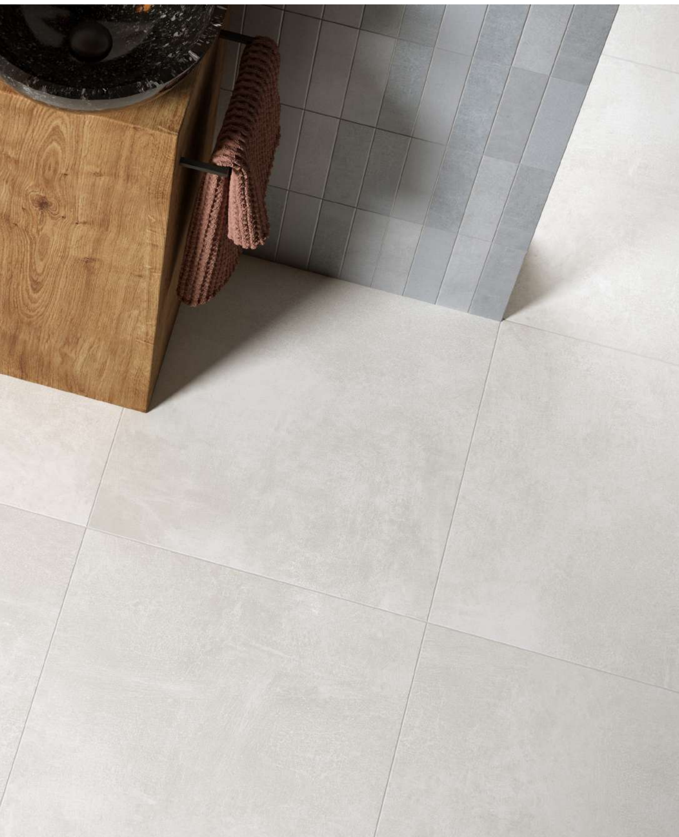
PAVIMENTO: ROMA 60x60 BIANCO