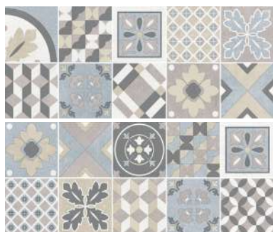
25x60 DECORO MAIOLICHE HRWD01